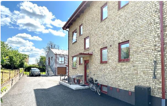
Gatubild på Borgmästaregatan 8.

Intresse, maila till info@johanssonsfastigheter.se , och skriv i ämnesraden: A103