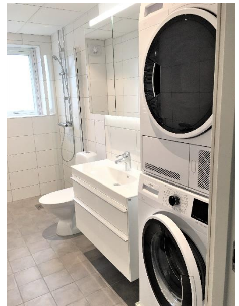
Bild på badrummet.