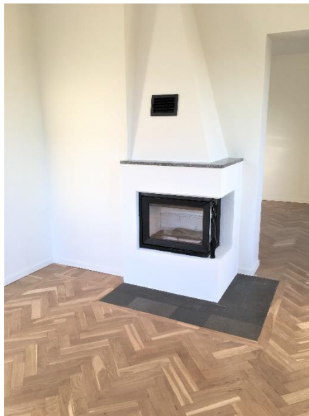
Bild på öppen spis.