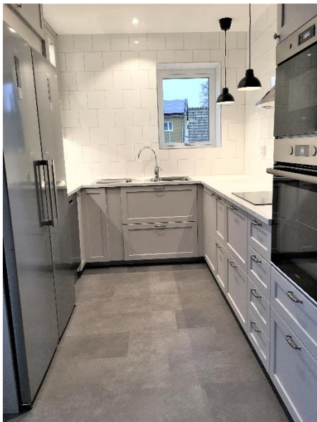
Bild på köket.