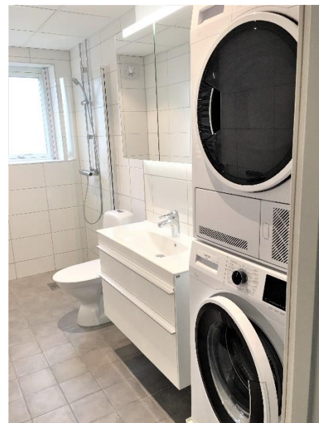
Bild på badrummet.