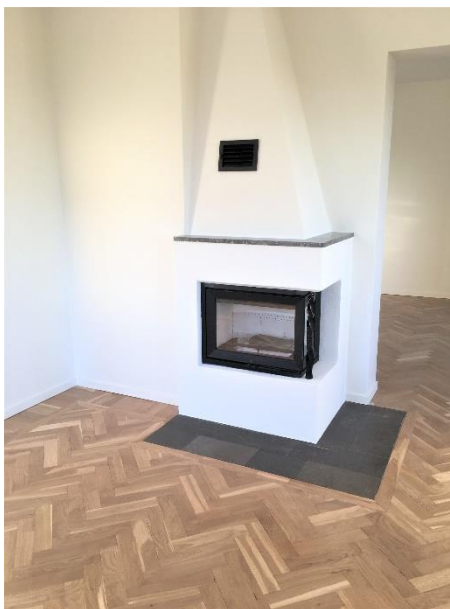
Bild på öppen spis.