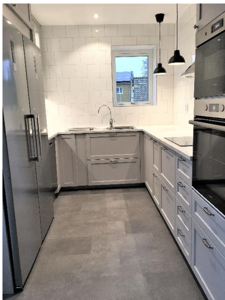
Bild på köket.