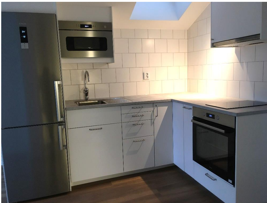
Bild på kök i lgh A-105.